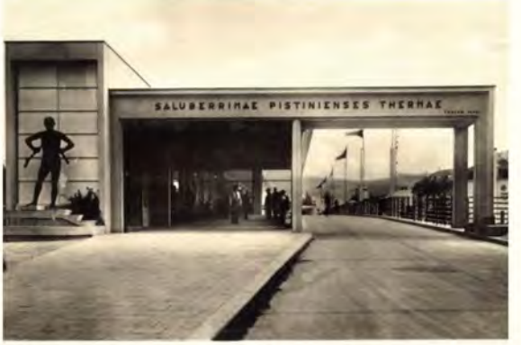
"איינע פון די שענסטע בריקן אין די וועלט" - אמאל און היינט