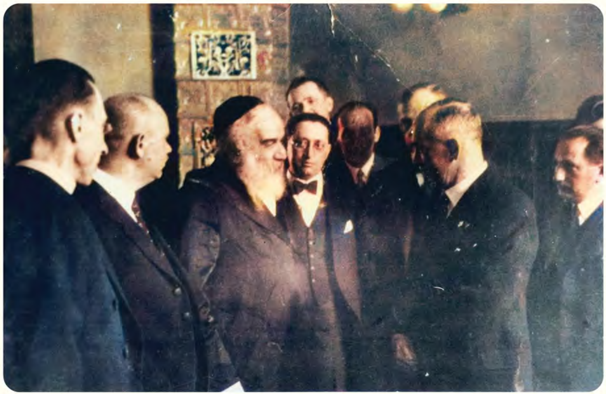
באריכט אין 'יודישע צייטונג' און באקאנטער בילד פון דר. בענעש אין מונקאטש - לחזות באור פני מלך, רבינו זי"ע

בעזוך פון אויסערן מיניסטער דר. בענעש אין מונקאטש עס איז קיין חידוש האם די וועלט וועגן דעם בעזוך פון אויסערן מיניסטער דר. בענעש אין קארפ. דעם און ספעציעל און די שמעקס אינגוואר, מיט קאמפ. ספעציעל און די חובס, האם צו אונטערן מיט די נאכבאר סיניט און ספעציעל מיט אינגוואר. די האנדלעס ספעציעל מיט אונטערן וועגן צוליב פארשידען סיבות שוין איינע ווארד יען אונטערן מיט האם נעם נעם בען, אין דעם דאס האם נעשען אין צו האפען אז אונזערע בקשות וועלען קענען האלפען נישט קינען פרוילינאציעס און וועלען באווערן אויף אמת און יוסף ווען לען א נעשענען קעמאל האפען.