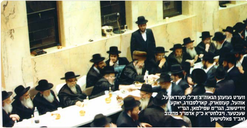
ווערט געזעהן הגאון"צ זצ"ל: סערדאהעל, אוהעל, קעזמארק, קארלסבורג, יאקע זידיטשוב, הגר"מ שפילמאן, הגר"י שעכטער, ויבלחטי"א כ"ק אדמו"ר מדינוב ואב"ד פאלטישען