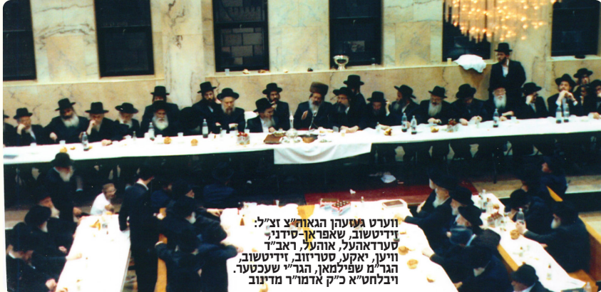
ווערט געזעהן הגאון"צ זצ"ל: זידיטשוב, שאפראך-סידיניץ סערדאהעל, אוהעל, ראב"ד ווען, יאקע, סטריזוב, זידיטשוב, הגר"מ שפילמאן, הגר"י שעכטער, ויבלחטי"א כ"ק אדמו"ר מדינוב