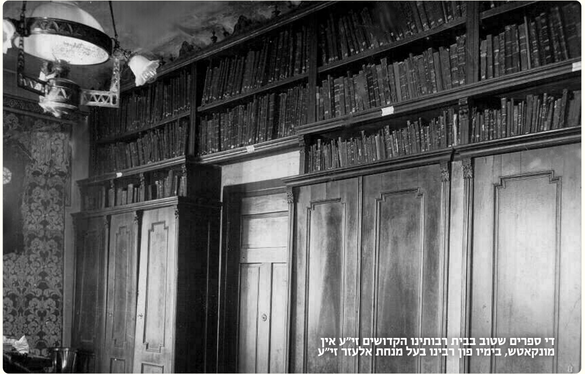
די ספרים שטוב בבית רבותינו הקדושים זי"ע אין מונקאטש, בימיו פון רבינו בעל מנחת אלעזר זי"ע

פון הקדוש ברוך הוא מוזן מיר אננעמען, אבער וואס פאר א שייכות האט דער שטן מיט אונז?