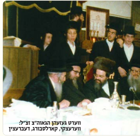
ווערט געזעהן הגאון"צ זצ"ל: ווערעצקי, קארלסבורג, דעברעצין